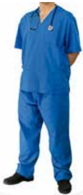
FATO BLOCO AZUL