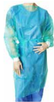
BATA CIRCULAÇÃO COM PUNHO