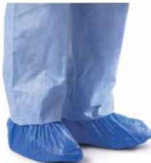
COBRE SAPATOS PLASTICO AZUL