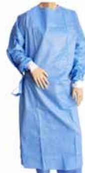
BATA CIRÚRGICA STANDARD ESTERILIZADA