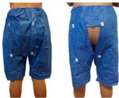
CALÇÃO COM ABERTURA