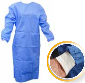
BATA CIRCULAÇÃO COM PUNHO IND. AZUL OPACA