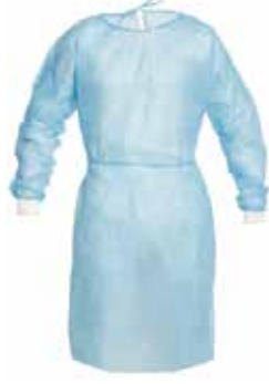
BATA PROTEÇÃO COM PUNHO IMPERM. AUTOCLAVÁVEL BRANCA