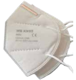
MÁSCARA FACIAL FFP2