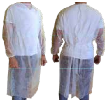
BATA CIRCULAÇÃO SEM PUNHO