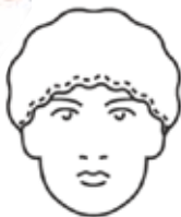
TOUCA TNT COM FOLHO TOUCA TNT SEM FOLHO IMPER.