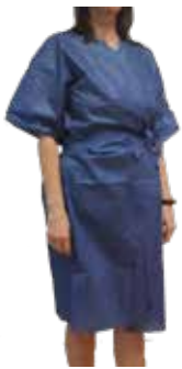
BATA CIRCULAÇÃO 1/2 MANGA AZUL OPACA