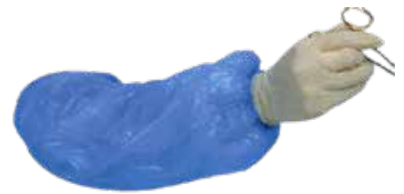
MANGUITO PLÁSTICO COM ELÁSTICO