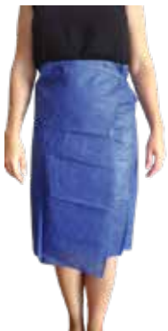
SAIA GINECOLOGIA TIRAS DESC.