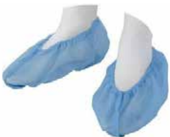
COBRE SAPATOS TNT AZUL