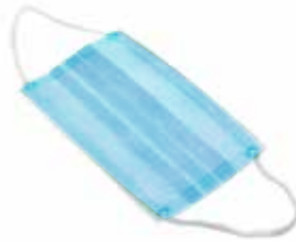
MÁSCARA CIRURGIA ELASTICOS AZUL