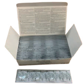
PRESERVATIVOS LATEX INDIVIDUALIZADOS