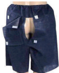
CALÇÃO C/ ABERTURA 68X62CM