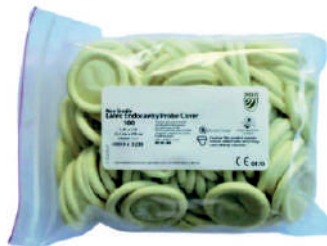
PRESERVATIVOS LATEX AVULSO