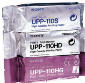
PAPEL IMPRESSORA SONY UPP