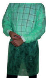
BATA CIRCULAÇÃO C/PUNHO VERDE