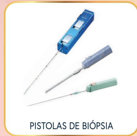
PISTOLAS DE BIÓPSIA