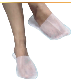
CHINELO ANTIDERRAPANTE BRANCO