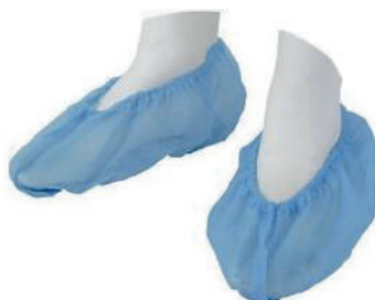
COBRE SAPATOS TNT AZUL