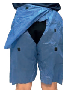
CALÇÃO C/ ABERTURA 70X68CM