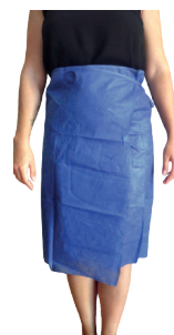
SAIA GINECOLOGIA TIRAS DESC