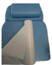
PAPEL MARQUESA PLASTIFICADO ECO