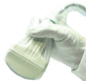
PRESERVATIVOS PARA SONDAS CONVEXAS E LINEARES