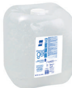
GEL ULTRASSONS 5KG