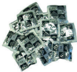
PRESERVATIVOS LATEX INDIVIDUALIZADOS SILICONE