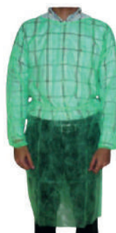
BATA CIRCULAÇÃO S/PUNHO VERDE