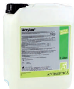
DESINFETANTE SONDAS LÍQUIDO ACRYLAN 5L