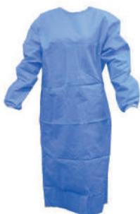
BATA CIRCULAÇÃO COM PUNHO IND. AZUL OPACA