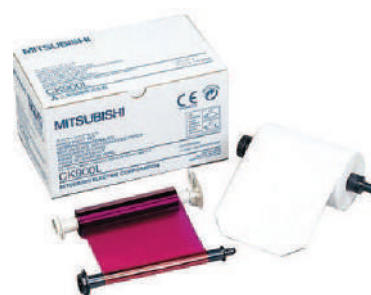
PAPEL IMPRESSORA MITSUBISHI CK