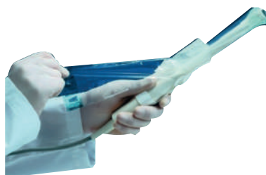
PRESERVATIVOS SEM LATEX COM GEL