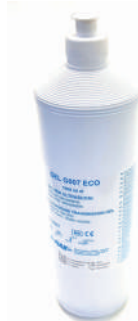
GEL US 1KG