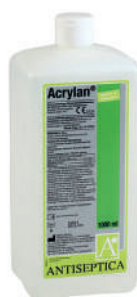
DESINFETANTE SONDAS LÍQUIDO ACRYLAN 1L