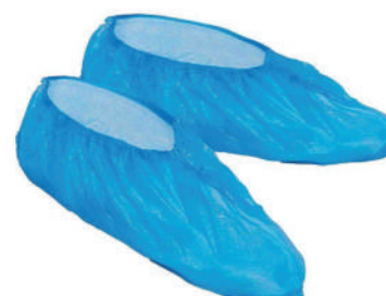
COBRE SAPATOS PLÁSTICO AZUL