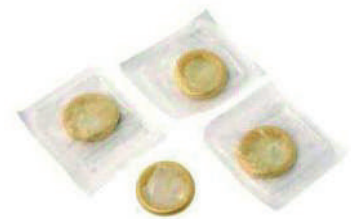
PRESERVATIVOS LATEX ESTERILIZADOS