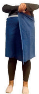
SAIA GINECOLOGIA VELCRO DESC.