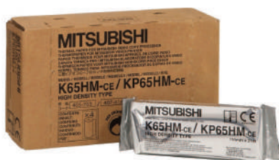
PAPEL IMPRESSORA MITSUBISHI KP