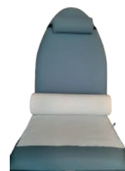
PAPEL MARQUESA CREPADO FOLHA DUPLA