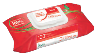
DESINFETANTE SONDAS TOALHETES 18X20CM