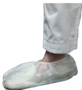
COBRE SAPATOS TNT BRANCO