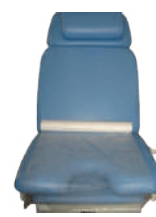
PAPEL MARQUESA TECIDO SOFT