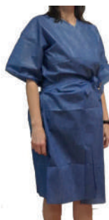
BATA CIRCULAÇÃO 1/2 MANGA AZUL OPACA