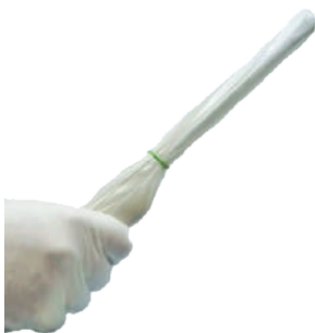
PRESERVATIVOS SEM LATEX