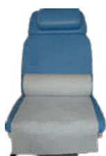
PAPEL MARQUESA CREPADO ECO