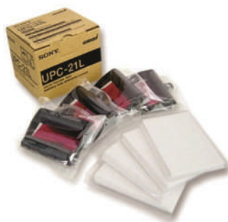
PAPEL IMPRESSORA SONY UPC