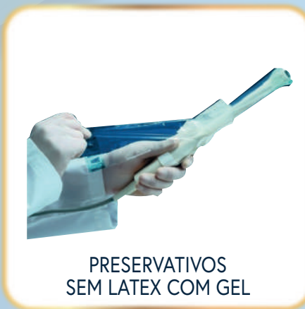
PRESERVATIVOS SEM LATEX COM GEL