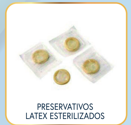
PRESERVATIVOS LATEX ESTERILIZADOS