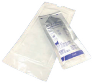
GEL US AZUL 20ML ESTERILIZADO