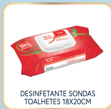
DESINFETANTE SONDAS TOALHETES 18X20CM