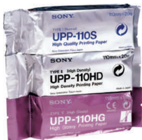
PAPEL IMPRESSORA SONY UPP