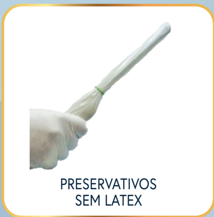
PRESERVATIVOS SEM LATEX