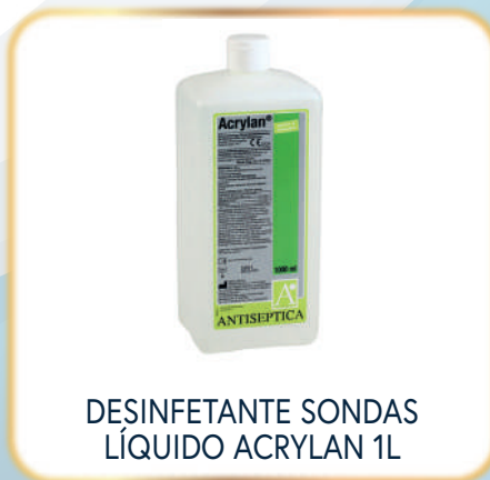
DESINFETANTE SONDAS LÍQUIDO ACRYLAN 1L