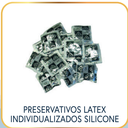
PRESERVATIVOS LATEX INDIVIDUALIZADOS SILICONE