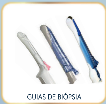
GUIAS DE BIÓPSIA