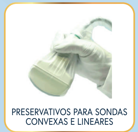
PRESERVATIVOS PARA SONDAS CONVEXAS E LINEARES