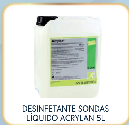
DESINFETANTE SONDAS LÍQUIDO ACRYLAN 5L