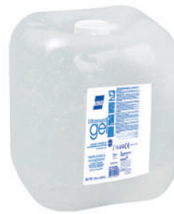
GEL ULTRASSONS 5KG