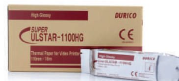
PAPEL IMPRESSORA COMPATÍVEL