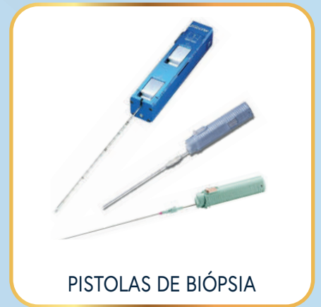
PISTOLAS DE BIÓPSIA