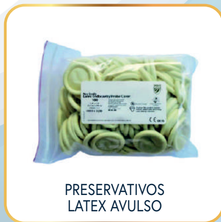
PRESERVATIVOS LATEX AVULSO