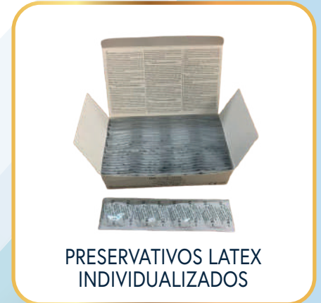
PRESERVATIVOS LATEX INDIVIDUALIZADOS