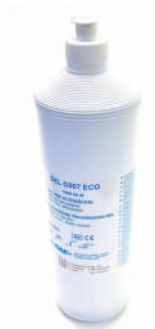
GEL US 1KG