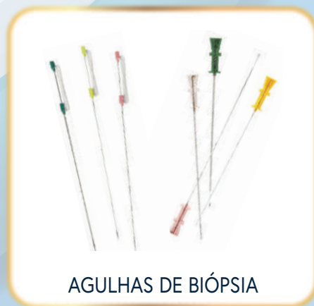
AGULHAS DE BIÓPSIA